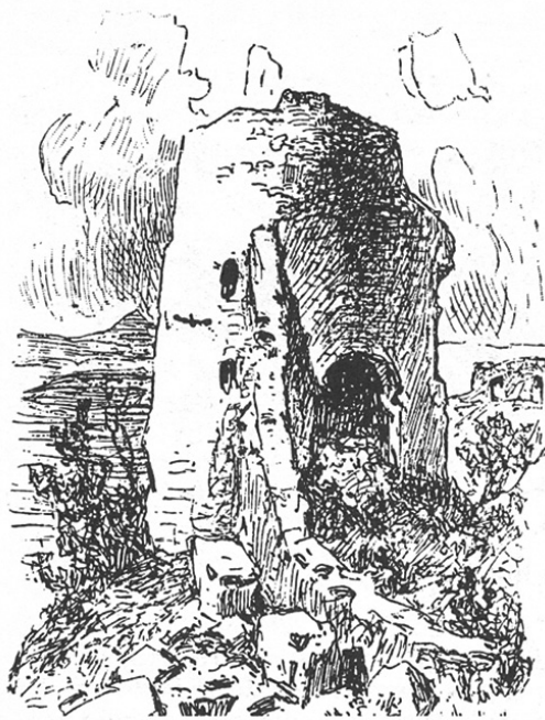
Рудник, остаци куле тврђаве, цртеж Феликса Каница (сл. 2)

Према томе, може се претпоставити да овде није реч само о конкретизованом историјском непријатељу, већ се једновремено ради и о митском противнику, демонском чудовишту, против кога се бори 'културни' јунак, претежно оличен у Карађорђевог лику. Према забележеним казивањима, Црни Ђорђе, потоњи вожд устаничке Србије, два пута је још пред буну Рудничког Бика држао на нишану, али је, услед бојазни од турске одмазде, једнако одустајао да окине обарач. Најпре је то било у манастиру Вољавчи (Пантелић 1980, 93–95, 128–129), а други пут у селу Страгарима (Ђурић 1980: 28–30).