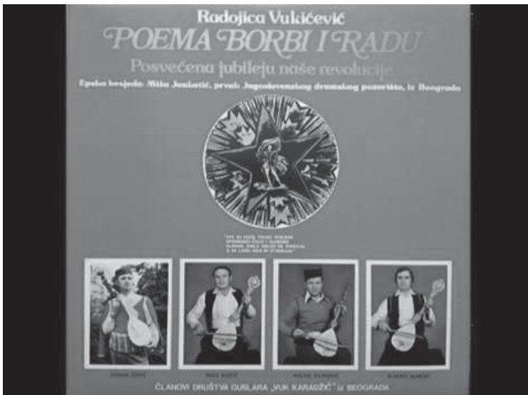
Слика 1. Poema borbi i radu . Članovi Društva guslara „Vuk Karadžić“ iz Beograda Jugoton, LSY 61330, 1981.